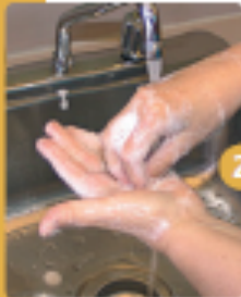
2 Frottez le bout des doigts.

Gardez les ongles courts sans vernis et ne portez ni ongles artificiels, ni bijoux.