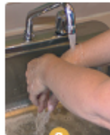
8 Rincez en vous assurant d'enlever toute trace de savon.