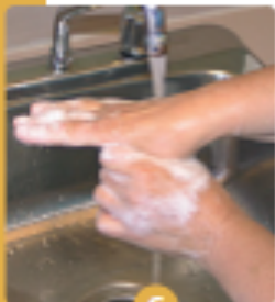
6 Encermez les pouces avec la main opposée et frottez.