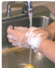
7 Frottez chacun des poignets.