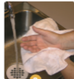
9 Asséchez bien les mains en tapotant avec du papier.